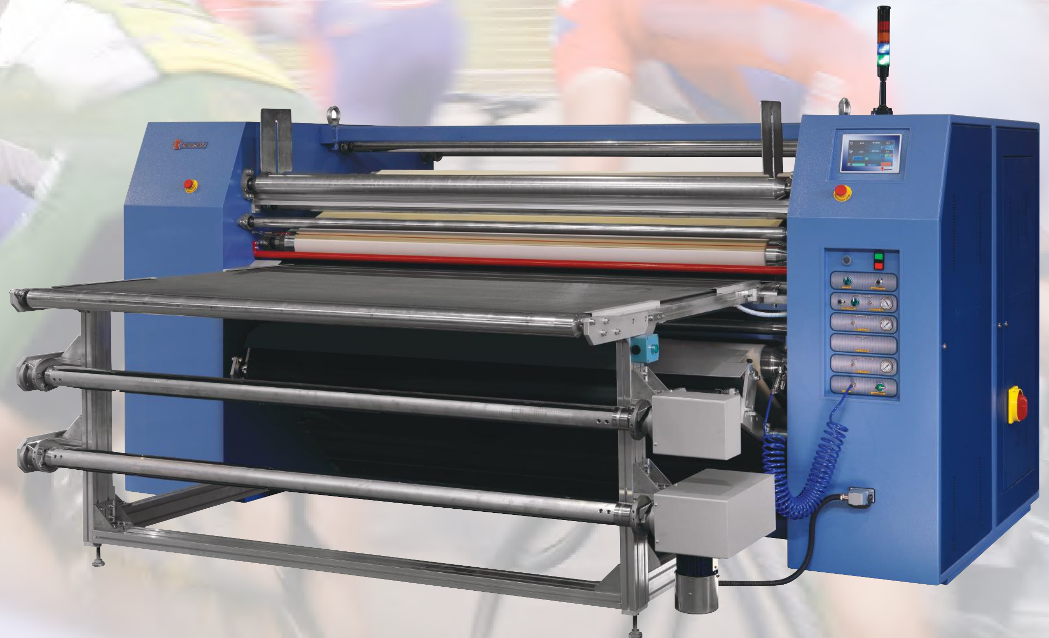
Heat Seal Machines

Termostampa in sublimazione su maglieria sportiva Sublimatic heat print on jerseys Sublimationsdruck auf Sporttrikots Sublimation sur tricots de sport